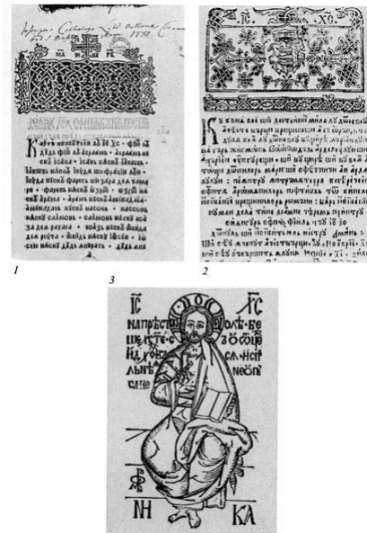
40. Die frühesten Zeugnisse des rumänischen Buchdrucks: 1 auszugsweise rumänische Bibelübersetzung für den liturgischen Gebrauch. Kronstadt 1561; 2 auszugsweise rumänische Bibelübersetzung (Palia de la Orastie) für die reformierten Rumänen in Siebenbürgen, mit dem Wappen Sigismund Báthorys. Broos 1582; 3 Monogramm des ersten rumänischen Druckers, Meister Filip, auf dem Hermannstädter Evangeliar, 1546