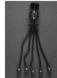
2. Goldener Anhänger mit Eberkopf aus dem gepidischen Königsgrab Nr. I von Apahida