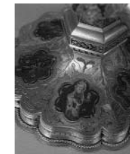
3. 1 Kelch von Salzburg. Vermutlich ein Geschenk von Ludwig dem Großen. 14. Jahrhundert (?) 2-3 Details des Kelchfußes mit den Gestalten des hl. Georg und der hl. Barbara in Emaille