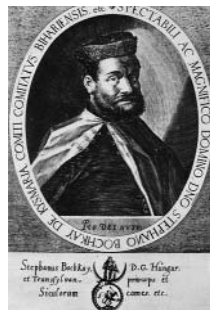
41. Porträt Stephan Bocskais. Kupferstich, 1605/06