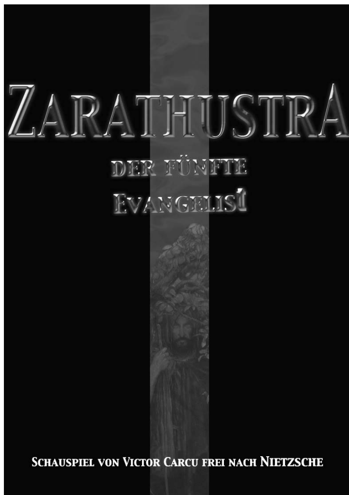
Plakatentwurf: Victor Carcu